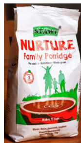
Farine de porridge pour la famille Nurture