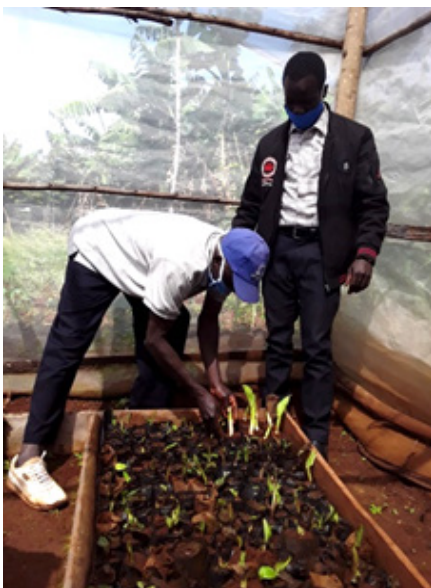
Le soutien de Stawi Foods aux producteurs de bananes

Stawi Foods travaille avec environ 5 000 petits exploitants kenyans organisés dans des groupes d'environ 30 membres, dont 80 % sont des femmes et 30 % des jeunes. En moyenne, les agriculteurs sont âgés de 40 ans et exploitent 5 000 acres de terre.