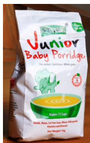
Farine de porridge Junior 250g, 500g, 1kg