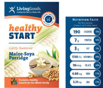
Farine de porridge enrichie produite par Stawi pour le marché institutionnel

Stawi Foods distribue essentiellement ses produits transformés sur le marché local à des familles kenyanes à faibles revenus. Elle a également un contrat de fabrication avec des organisations non gouvernementales au Kenya pour fournir des aliments nutritifs lorsque l'accès à la nourriture est très limité.