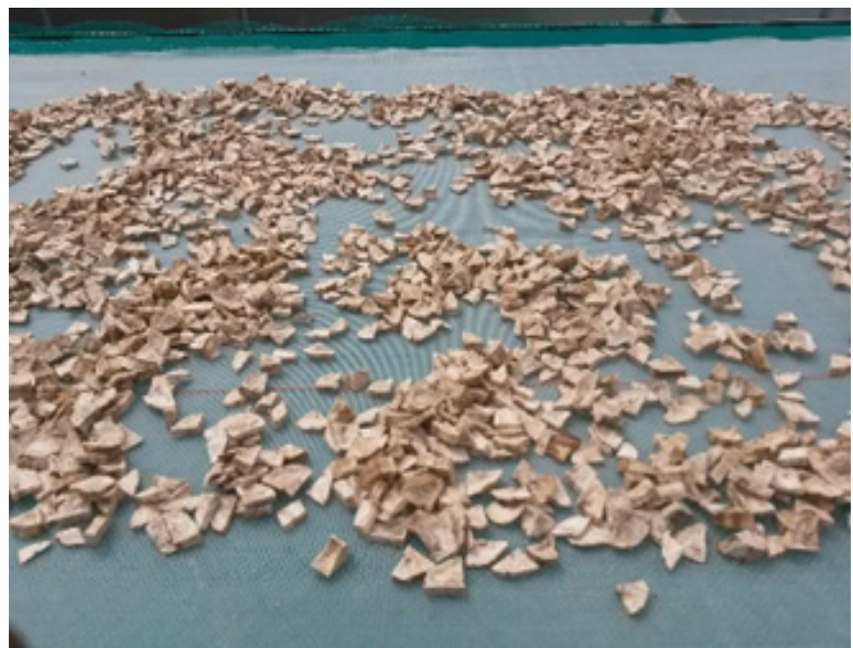
Séchage solaire des bananes par des groupes d'agriculteurs