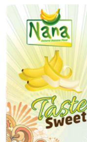
Farine de banane (sans gluten)